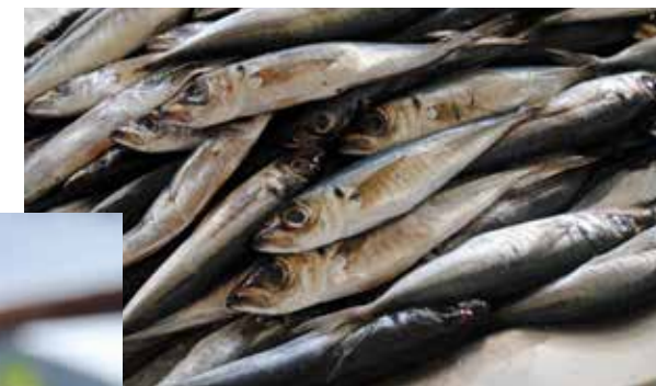
In der Libreria Aqua Alta lässt sich stundenlang in den unzähligen Bücherstapeln stöbern und mit etwas Glück eine echte Rarität ausgraben.