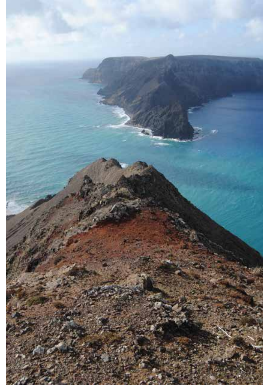
So menschenleer sind die traditionellen Kaffeehäuser am Markusplatz nur am frühen Morgen.