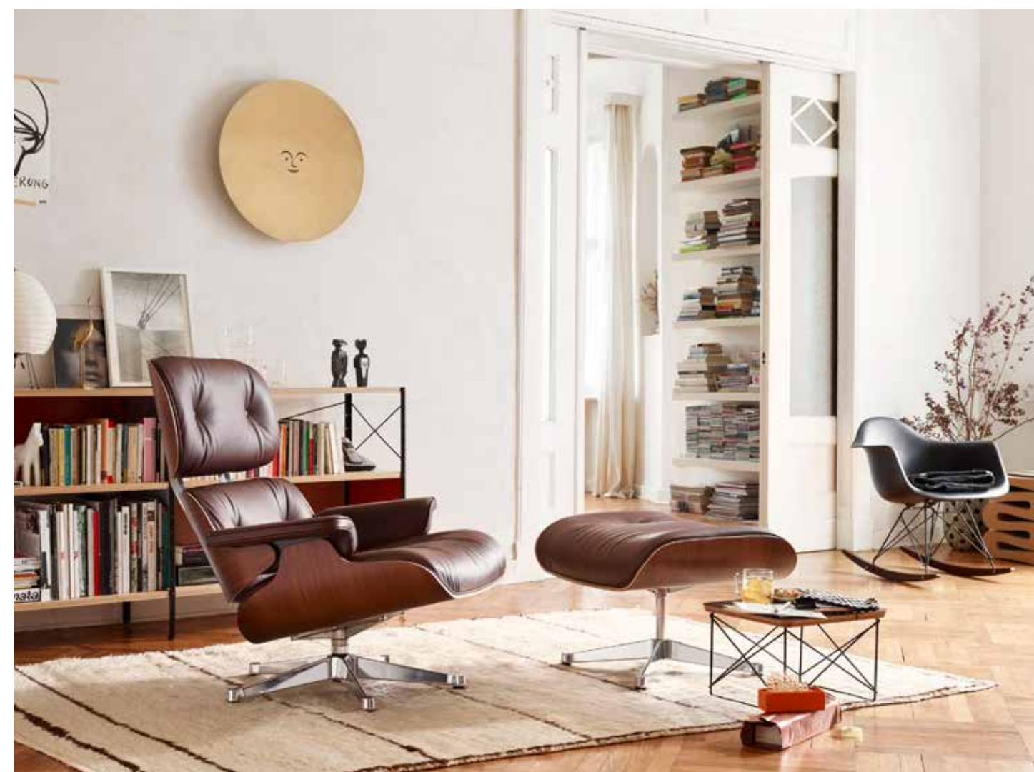
Lounge Chair & Ottoman Design: Charles & Ray Eames, 1956